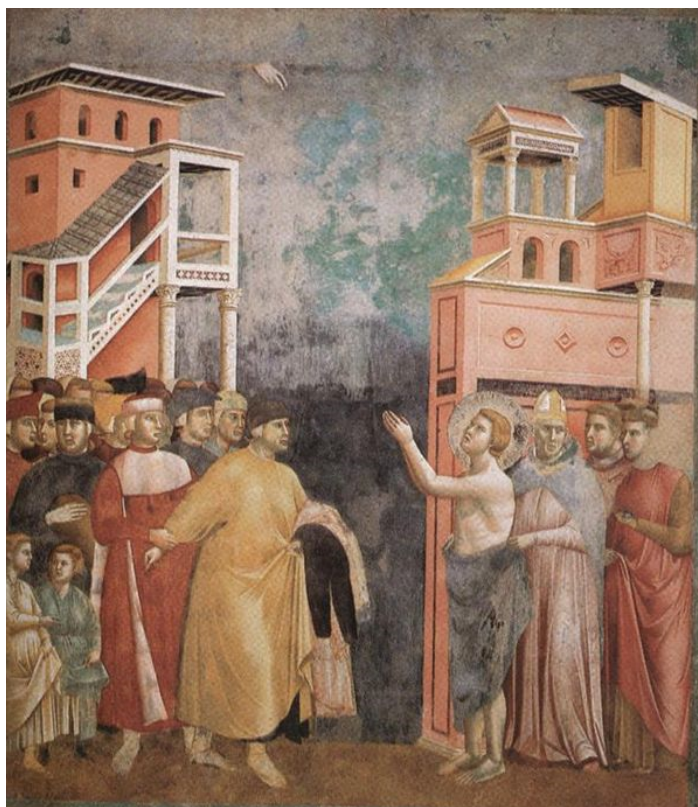
Une des fresques de Giotto retraçant la vie de St François d'Assise . Ici, il renonce à tout bien terrestre, malgré la colère de son père, et se réfugie dans les bras de l'évêque Guide (1) .