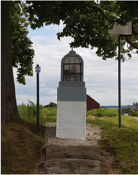
Chapelle Sainte Anne