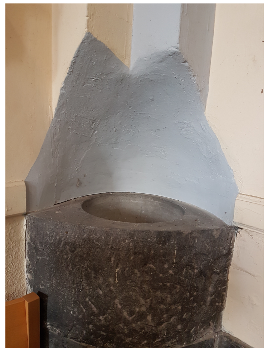
Les fonds baptismaux se situent aujourd'hui comme ils l'étaient en 1849 (en entrant, dans l'angle gauche de l'église).