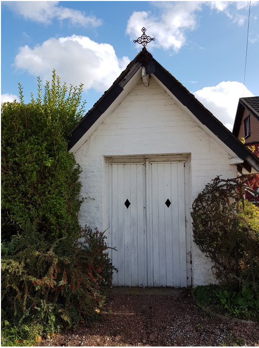
Chapelle Rue de la Marache