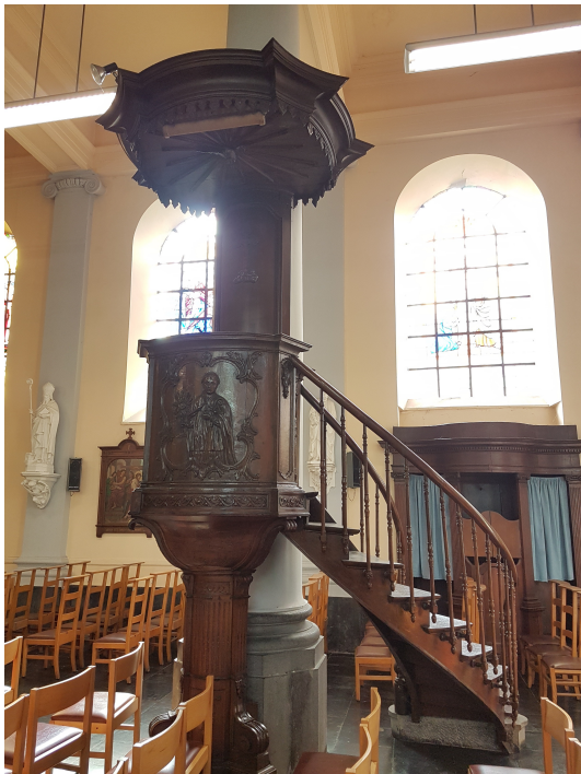
La Chaire de Vérité avec son bas relief représentant St Norbert, fondateur des Rédemptoristes.