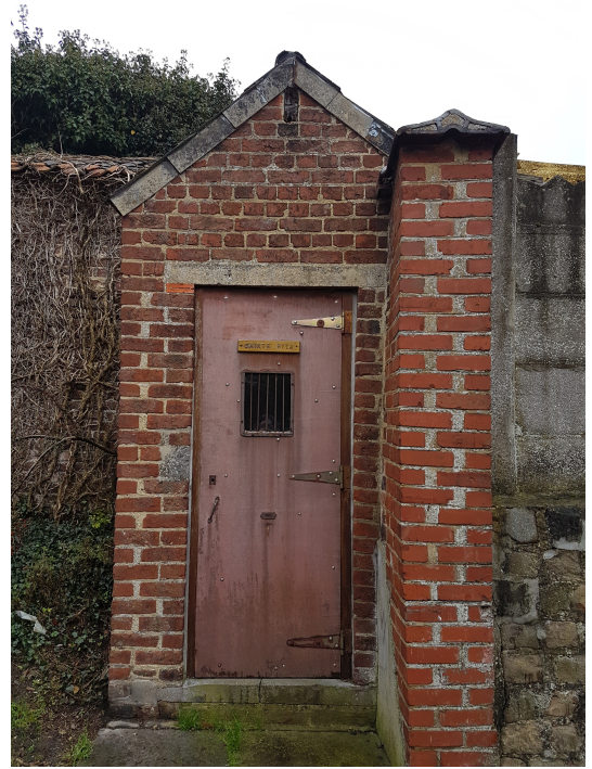
Chapelle Sainte Rita