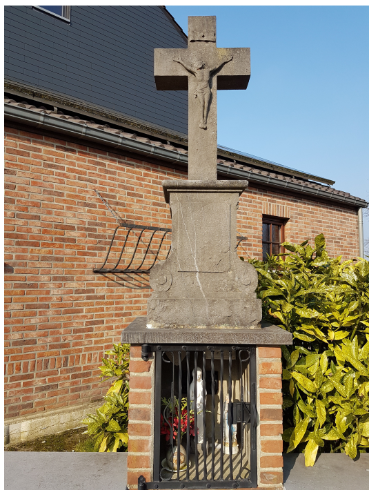
Rue du Cheval Blanc